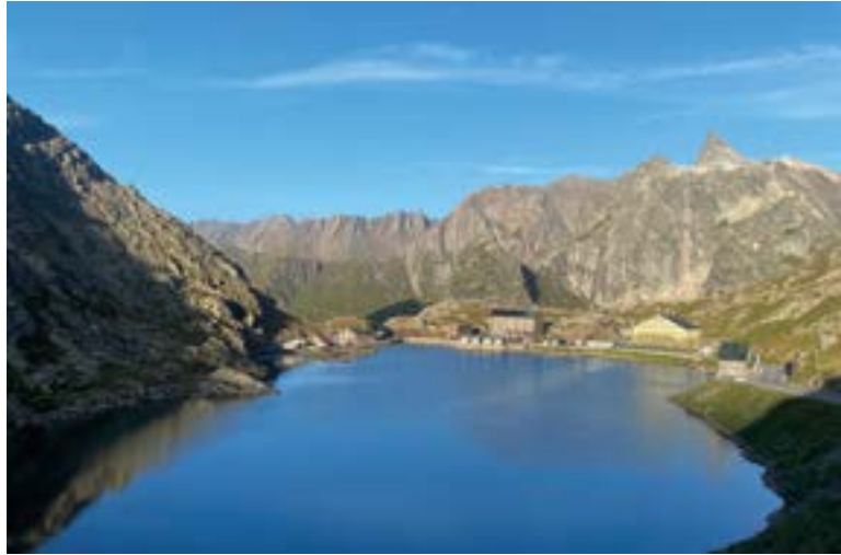
Col du Grand Saint-Bernard