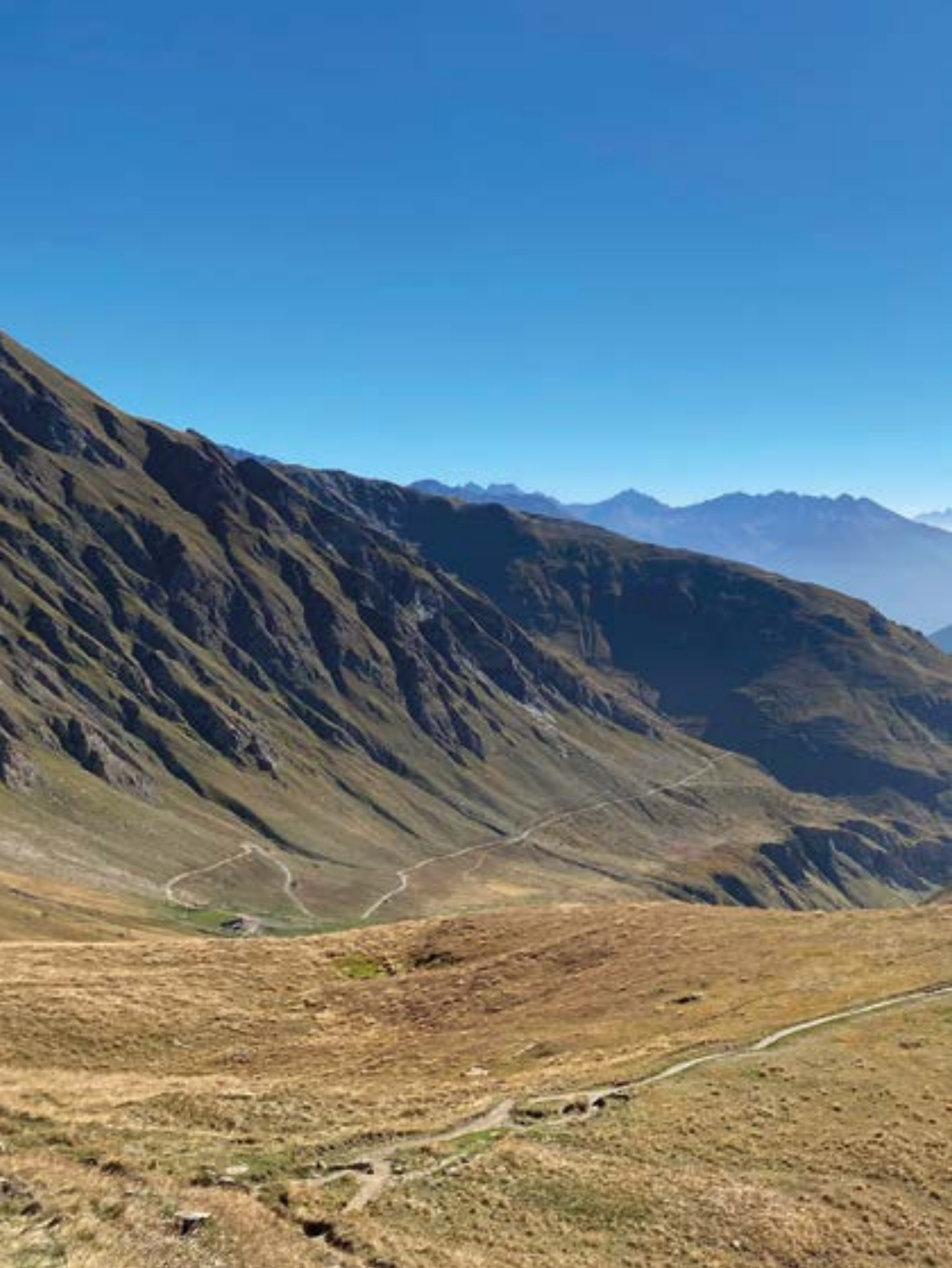
Succession de paysages depuis la combe des Merdeux