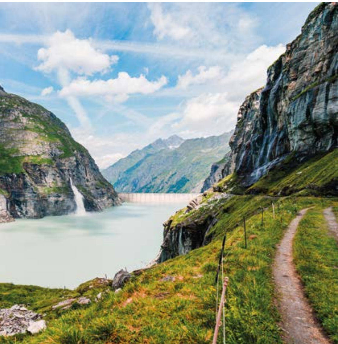
Barrage de Mauvoisin