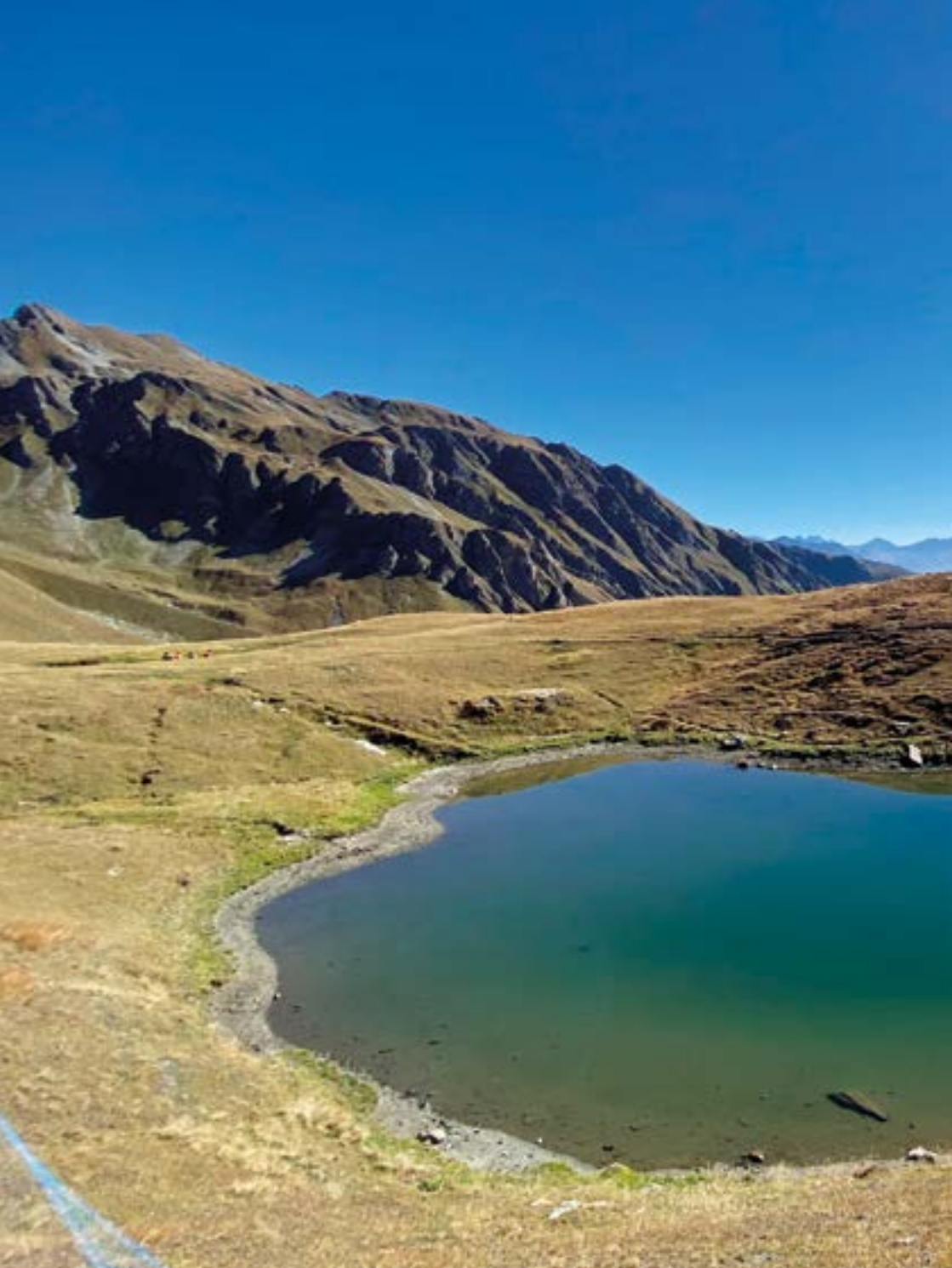
Lac des Merdeux, val d'Aosta