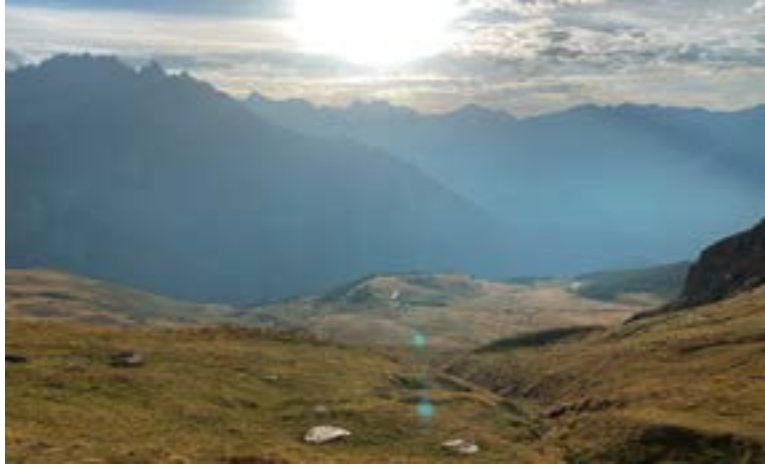
Lever du jour au refuge Champillon