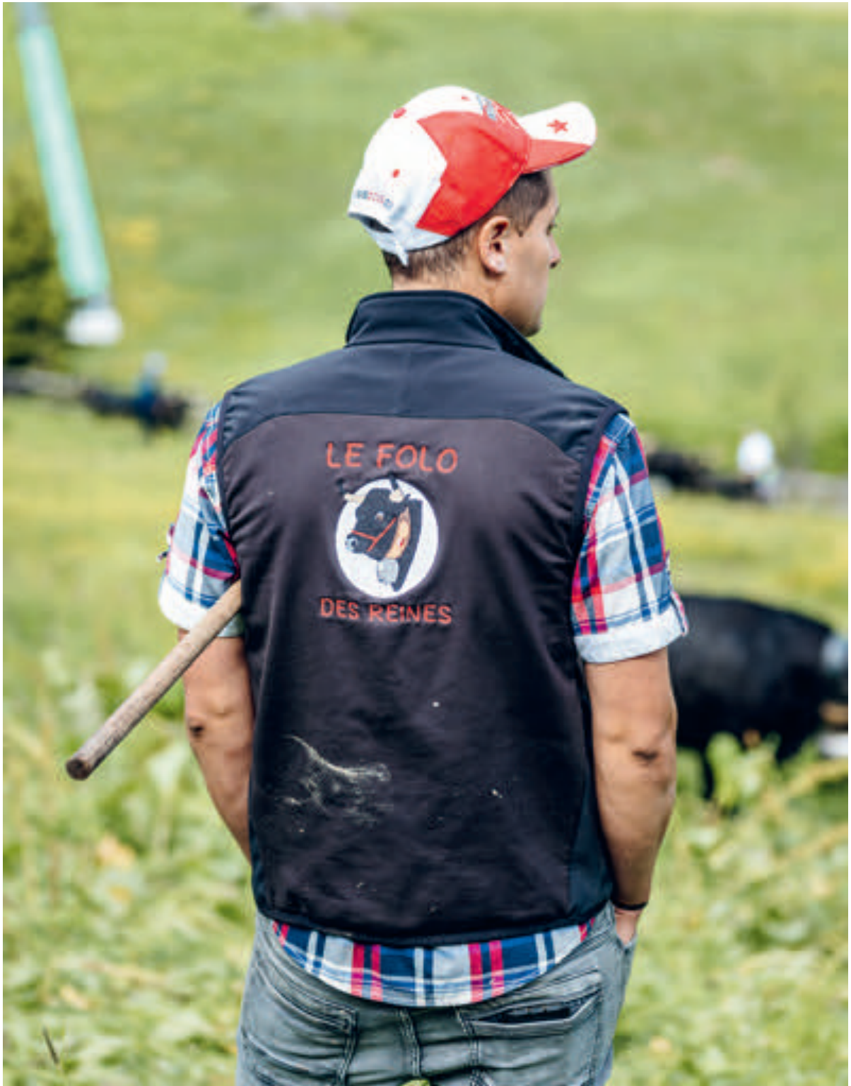
Super-Nendaz - Siviez, 2019. © Olivier Lovey