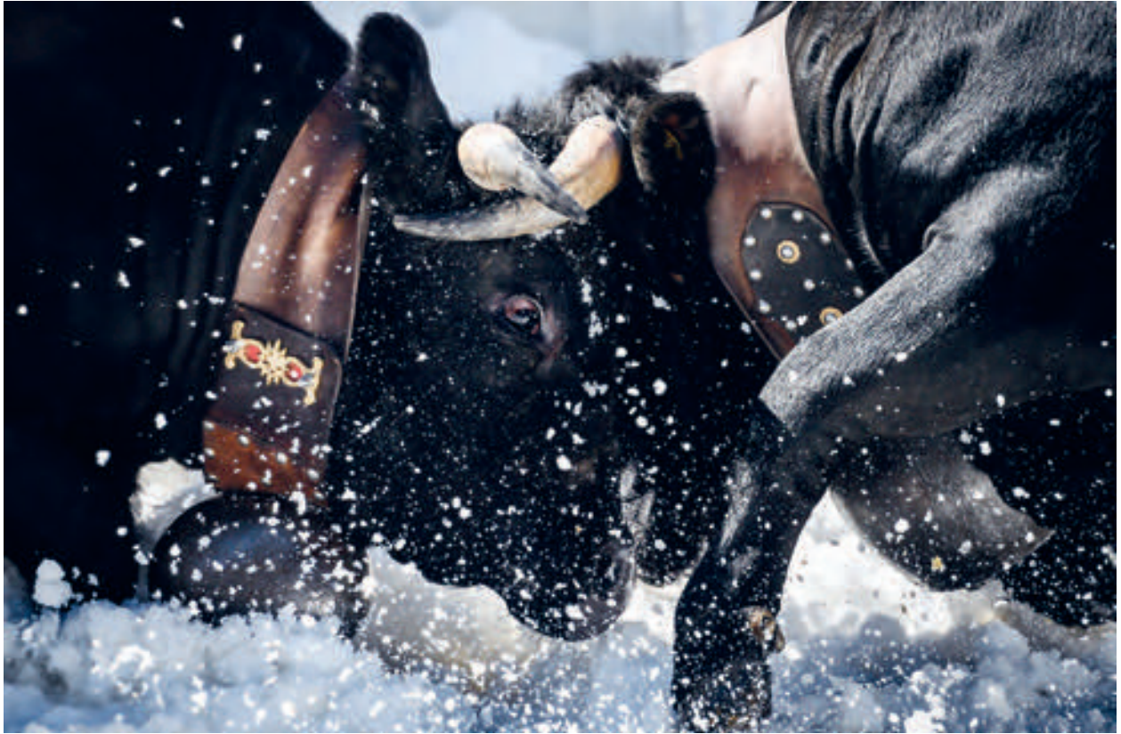
Albinen, 16. März 2019.