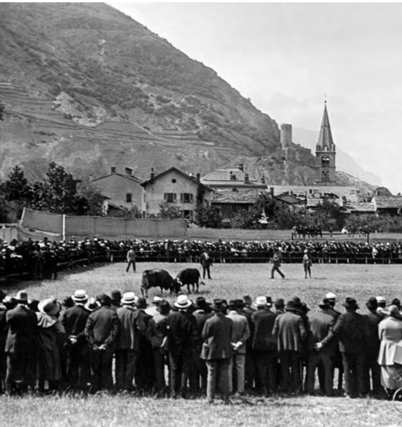
Combat de reines, Martigny, vers 1925.