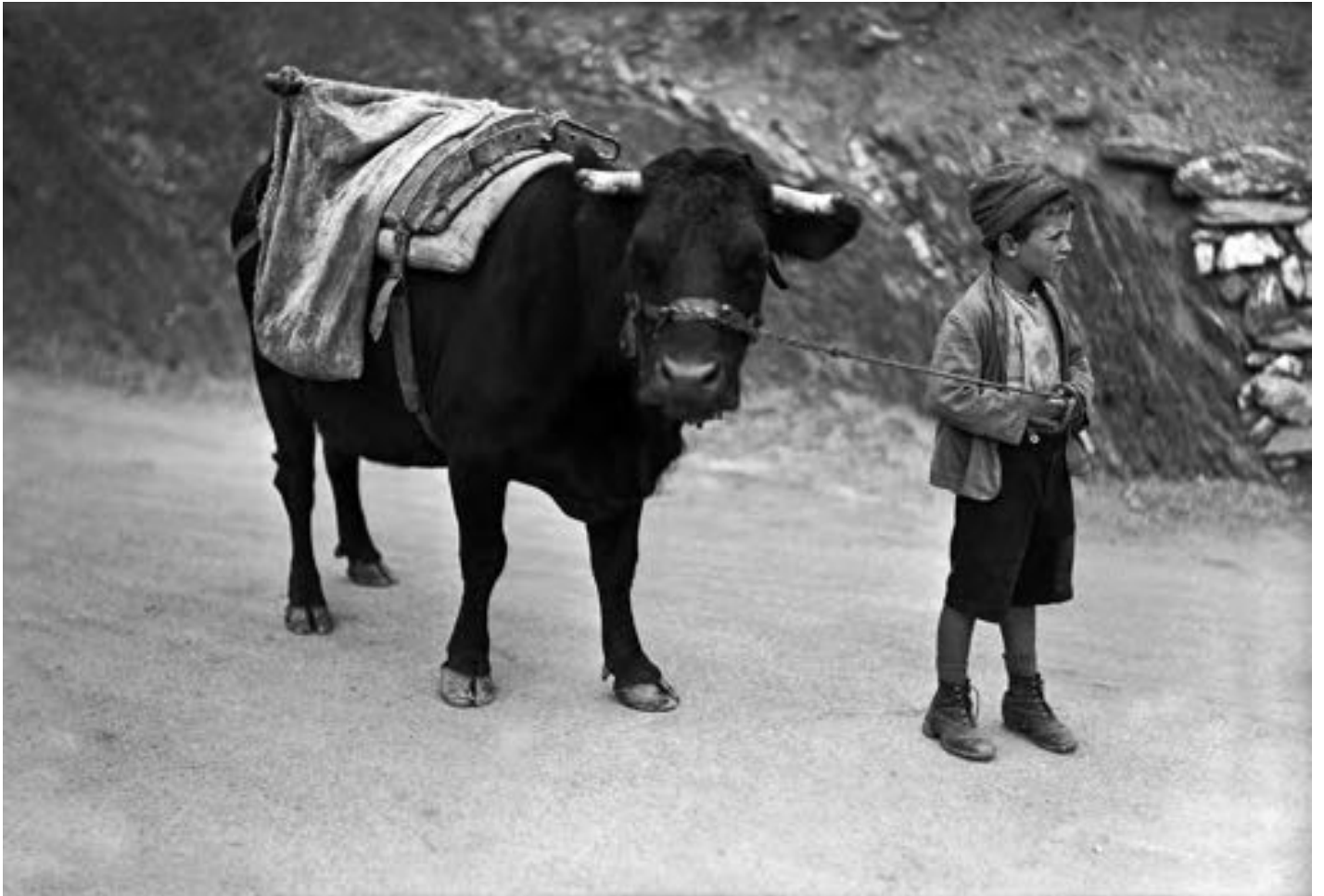
Montana, vers 1940.