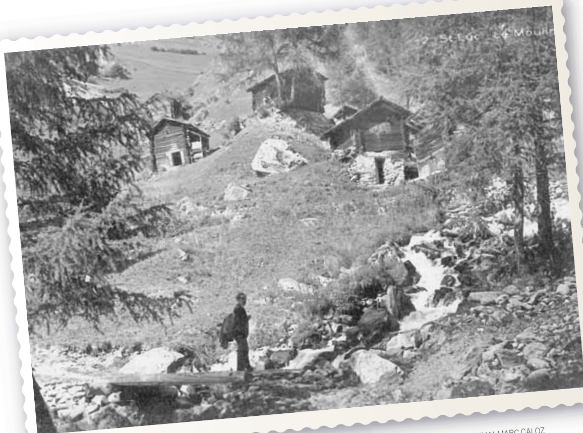
Les moulins de Saint-Luc, dans les années 1920.

lieux.» Des habitants des villages, la plupart membres de la commission et rédacteurs des Parcours historiques guideront les visiteurs. Des membres des bourgeoisies, des sociétés des villages et des associations présenteront les