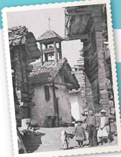
La chapelle de Chandolin.