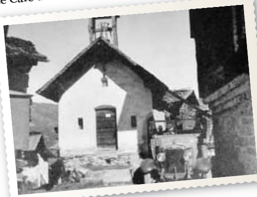
Cuimey, vers 1950.