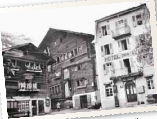
L'ancien Hôtel des Alpes, Vissoie, au début du XXe siècle.